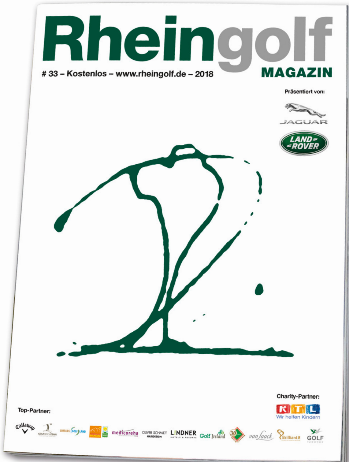
Titelseite des RHEINGOLF Magazins 2018

Das RHEINGOLF MAGAZIN online durchblättern auf www.rheingolf.de