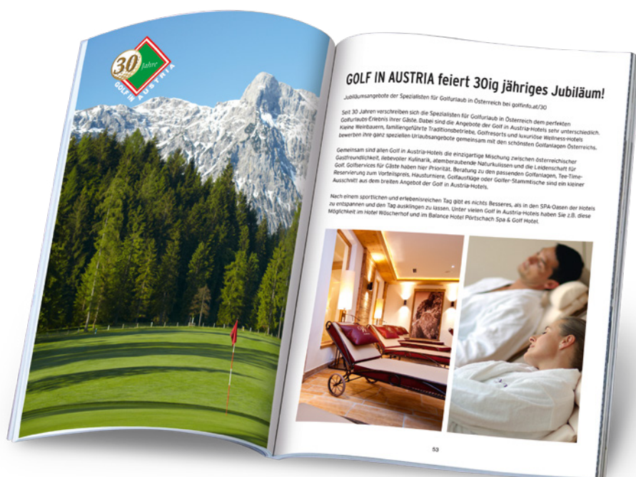
Destinations und Hotelvorstellungen im RHEINGOLF Magazin 2018