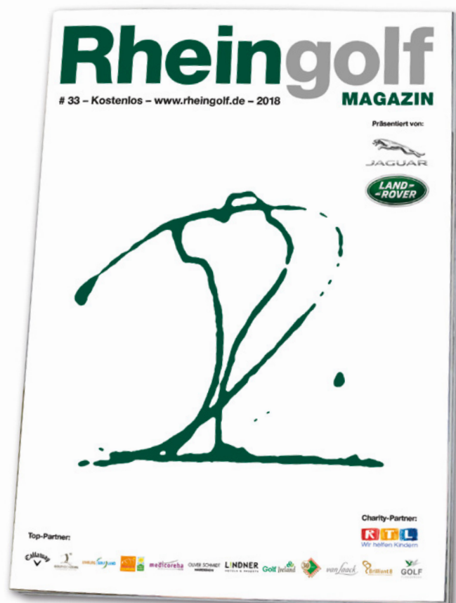
Titelseite des RHEINGOLF Magazins 2018

DIN A4 (B/H in mm: 210 x 297), komplett in 4c gedruckt, Offsetdruck